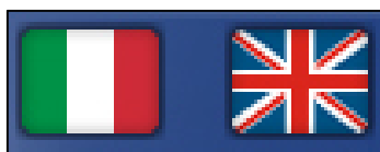
Figura 1: Le bandiere per cambiare la lingua

È possibile cambiare la lingua nella pagina di login ed in qualsiasi pagina interna al mercato.