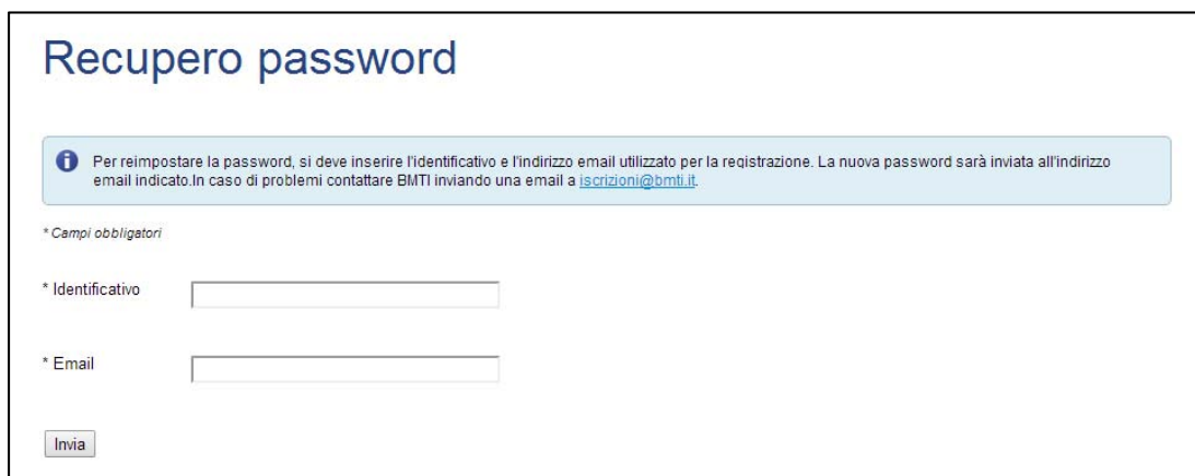
Figura 6: la pagina per il recupero della password

I campi obbligatori da compilare sono l'Identificativo e l'indirizzo email associato al proprio account. La piattaforma genererà una nuova password che sarà inviata tramite email all'indirizzo di posta elettronica specificato.